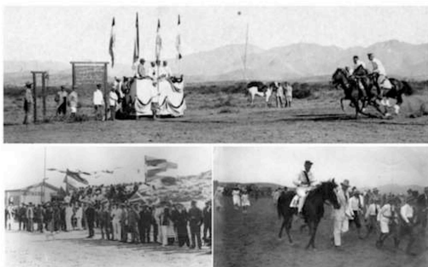
Três cenas de corridas de cavalos na Baía de Lüderitz das primeiras décadas do século xx. National Archive of Namibia (Windhoek), Nr. 02462/00332/05906