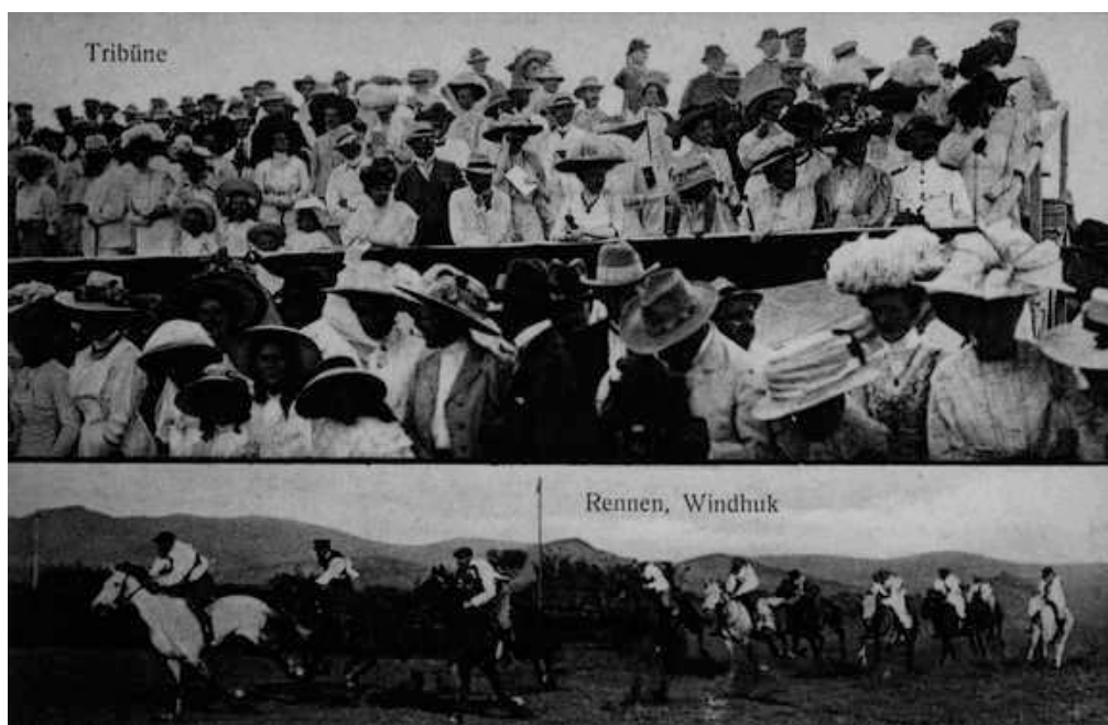
Na tribuna, destaca-se a expressiva presença feminina durante uma corrida de cavalos em Windhoek.

42 Com base na imprensa local, pode-se inferir o quanto as corridas de cavalos eram ocasiões especiais para a vida social, inclusive das mulheres brancas. A participação feminina pareceu ser uma constante durante as corridas de cavalos. Com certa constância, as matérias se referiam à presença do público feminino, que, geralmente, exibia sua beleza “como nunca se vê nas ruas da Baía de Lüderitz” ( Lüderitzbuchter Zeitung , 31.07.1909). A tribuna das corridas de cavalos era como uma vitrine, onde se podia ver “o que há de novo e chique na moda feminina” ( Lüderitzbuchter Zeitung , 19.11.1910). Pode-se perceber o quanto as roupas e acessórios das damas confirmavam a importância daquelas reuniões sociais em torno das corridas de cavalos.